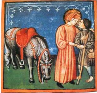
Miniatur aus der Legenda Major

Die verschiedenen Stimmen, Anfragen und Meinungen, die zu meinen Ohren gekommen sind, hörten sich teilweise als ein Vorwurf und eine leichte Kränkung an. Nach dem Motto: die FG wurde nicht eingeladen, man hat uns nicht dabei haben wollen, man ist mit uns schlecht umgegangen. Es mag sein, dass die Kommunikation zwischen dem Kloster, dem Vorstand der FG und der Gemeinschaft, besser hätte funktionieren müssen. Nun man rechnet in solchen Situationen immer auch damit, dass der gute Wille und das allgemeine Wohlwollen der Beteiligten und Interessierten stärker sind als Missgunst, Verdächtigungen und der bissige Tratsch.